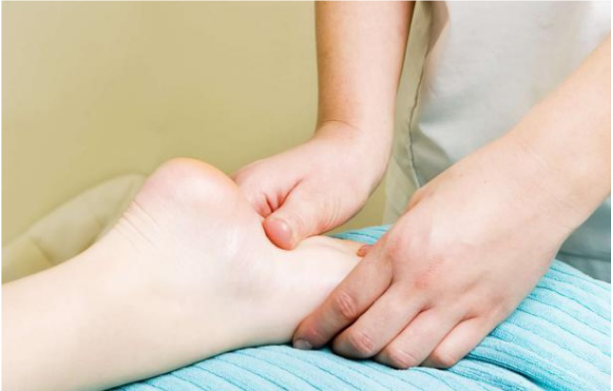
Réflexologie plantaire, illustration.